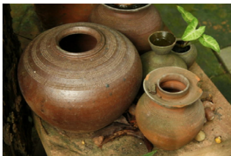
ภาพที่ ๑ แสดงงานเครื่องปั้นดินเผารูปแบบดั้งเดิม

แต่เดิมในอดีตในช่วงก่อนปี พ.ศ. ๒๕๐๐ งานเครื่องปั้นดินเผาด่านเกวียนรูปแบบดั้งเดิมเป็นที่นิยมผลิต และขึ้นชื่อว่ามีควมสวยงามหางานเครื่องปั้นดินเผาที่ใดเหมือนได้ จึงได้ดึงดูดผู้คนที่สนใจเข้ามาในพื้นที่ด่านเกวียนอย่างมากมายทั้งอาจารย์ นักวิชาการ ศิลปินและนักศึกษา โดยกลุ่มคนเหล่านี้มีความรู้ความสามารถในด้านการออกแบบและการสร้างสรรค์งานศิลปะ จึงนำองค์ความรู้ดังกล่าวมาถ่ายทอดให้กับช่างปั้นพื้นบ้านในชุมชน ส่งผลให้ช่างปั้นพื้นบ้านเริ่มมีรายได้จากการผลิตเครื่องปั้นดินเผาแบบใหม่มากยิ่งขึ้น อย่างไรก็ตามถึงแม้จะมีรายได้มากขึ้น ช่างปั้นพื้นบ้านก็ยังคงนิยมสร้างงานเครื่องปั้นดินเผาด่านเกวียนรูปแบบดั้งเดิมอยู่เนื่องจากผลงานมีความสวยงามและมีอัตลักษณ์เฉพาะไม่มีที่ใดเหมือน ประกอบกับสภาพสังคมในชุมชนยังคงพึ่งพิงธรรมชาติเป็นหลัก ดังนั้นกระบวนการเปลี่ยนแปลงจึงไม่ได้รวดเร็วเกินไปนัก แต่อย่างไรก็ตาม เมื่อกระบวนการผลิตเชิงอุตสาหกรรมเริ่มเข้ามามีบทบาทในชุมชนมากขึ้นเรื่อยๆ จากรายได้ที่เพิ่มมากขึ้นจากการขายผลงานรูปแบบใหม่ๆ ส่งผลให้ช่างปั้นต้องเลือกผลกำไรมากกว่าวิถีชีวิตและงานแบบดั้งเดิม ผลงานเครื่องปั้นดินเผาด่านเกวียนจึงเริ่มเป็นไปในลักษณะผสมผสานระหว่างรูปแบบเก่าและรูปแบบใหม่ จนกระทั่งเมื่อนโยบายรัฐเข้ามาในปี พ.ศ. ๒๕๔๔ รัฐบาลมีนโยบายใช้ผลิตภัณฑ์ชุมชนเพื่อแก้ปัญหาวิกฤตเศรษฐกิจ งานเครื่องปั้นดินเผาด่านเกวียนจึงเปลี่ยนรูปแบบเป็นงานสมัยใหม่และกลายเป็นผลิตภัณฑ์ชุมชนหนึ่งในหลายผลิตภัณฑ์จากทั่วประเทศที่เข้าโครงการหนึ่งตำบลหนึ่งผลิตภัณฑ์ (OTOP: One Tambon One Product) นับแต่นั้นมาเครื่องปั้นดินเผาด่านเกวียนจึงกลายเป็นสินค้าที่มีชื่อเสียงและกลายเป็นสินค้าส่งออกสำคัญจนถึงปัจจุบัน (สืบศักดิ์ สิริมงคลกาล. ๒๕๖๐: ๒๔)