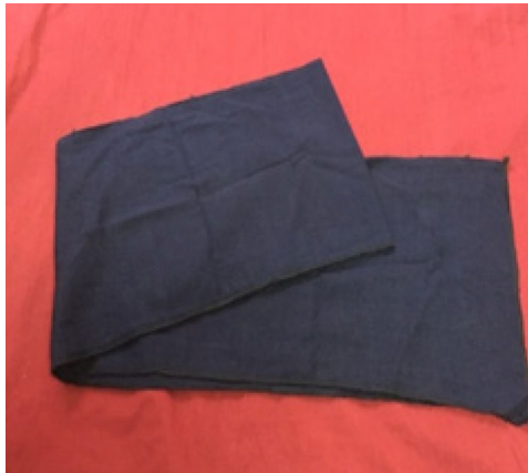
ภาพที่ ๒ ผ้าพันอก

ผ้าพันอกใช้ผ้าฝ้ายย้อมครามขนาดยาว ๒ เมตร