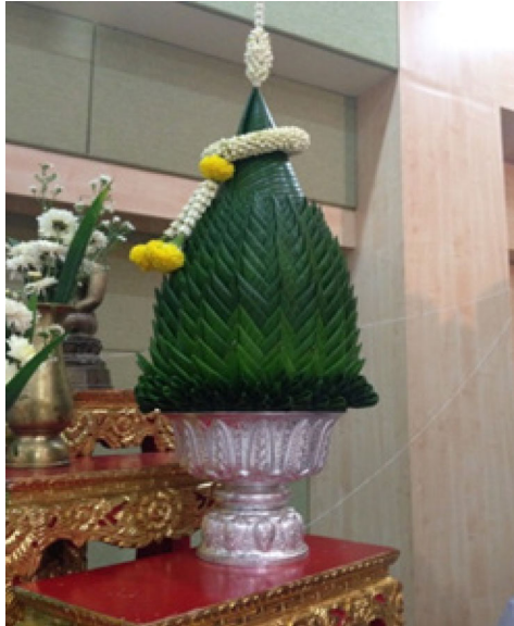
ภาพที่ ๑๐ บายศรี