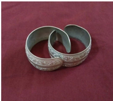
ภาพที่ ๘ กำไลข้อมือ

กำไลเงินเป็นโลหะสวมใส่สามารถปรับให้พอดีกับข้อมือ