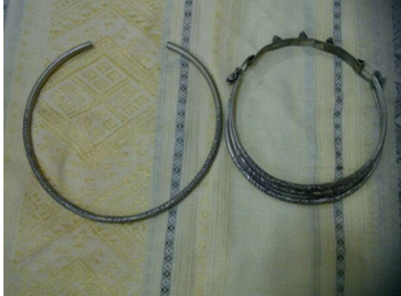
ภาพที่ ๖ สร้อยคอ

สร้อยคอเงินมี ๒ แบบ แบบมีห่วงเดียวกับแบบที่เป็น ๓ ห่วง