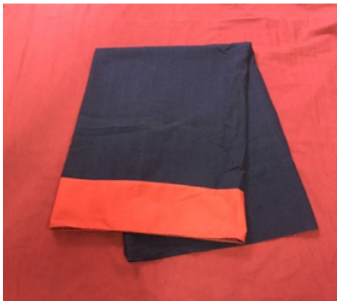
ภาพที่ ๓ ผ้าถุง