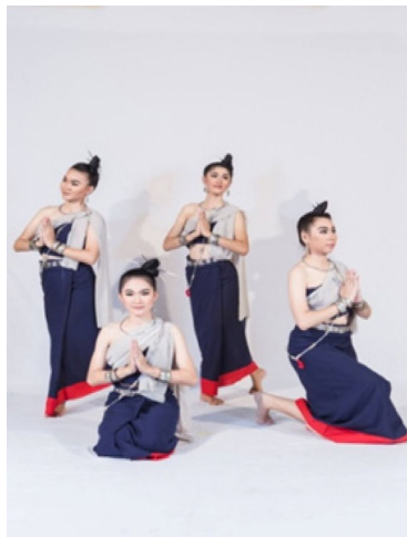
ภาพที่ ๑ การแต่งกายชุดฟ้อนศรีโคตมะปุระ

การแสดง ชุด ศรีโคตมะปุระ ได้ออกแบบการแสดง รูปแบบการแสดง และองค์ประกอบ การแสดง โดยสรุปได้ดังนี้ การแสดง ชุด ศรีโคตมะปุระ ใช้ผู้แสดงทั้งหมด ๑๐ คนโดยได้คัดเลือกนักแสดงที่มีความสามารถทางนาฏศิลป์ทำให้ง่ายต่อการฝึกซ้อมและต้องมีความตั้งใจขยันในการฝึกซ้อมซึ่งจะทำให้การฝึกซ้อมไม่เกิดปัญหา โดยผู้สร้างสรรค์ผลงานได้สร้างตารางการฝึกหัดการแสดงชุด ฟ้อนศรีโคตมะปุระ โดยกำหนดนัดหมายวัน เวลา สถานที่ที่ฝึกซ้อมอย่างชัดเจนเพื่อหลีกเลี่ยงปัญหาการนัดซ้อมผู้แสดงตรงกัน โดยฝึกซ้อมการนำเสนอผลงานเป็นเวลา ๑ เดือน โดยฝึกซ้อมการแสดงช่วงที่ ๑ เป็นเวลา ๑ สัปดาห์ ซ้อมการแสดงช่วงที่ ๒ เป็นเวลา ๑ สัปดาห์ ซ้อมการแสดงช่วงที่ ๓ เป็นเวลา ๑ สัปดาห์และซ้อมการแสดงช่วงที่ ๑-๓ ในสัปดาห์ที่ ๔ สถานที่ที่ใช้ฝึกซ้อม คือ ใต้อาคารหอประชุมใหม่ มหาวิทยาลัยราชภัฏอุดรธานี การแต่งกายของนักแสดง ผู้วิจัยได้ศึกษาการแต่งกายของชาวบ้านในสมัยศรีโคตบูรณ เนื่องจากในสมัยนั้น พบว่า การแต่งกายในสมัยก่อนจะไม่ค่อยได้มีเสื้อผ้าอาภรณ์ นุ่งห่มใส่กันและเสื้อผ้าจะไม่มีสีที่ฉูดฉาดจะเป็นสีตามธรรมชาติ ผู้สร้างสรรค์ผลงานจึงได้นำสีคราม มาทำเป็นสีผ้านักแสดง ส่วนเครื่องประดับ สร้อยคอ, ต่างหู, เข็มขัด, กำไลแขน, ก็อ้างอิงมาจากสมัยก่อนที่นำโลหะเงินมาทำเป็นเครื่องประดับ โดยที่ผู้สร้างสรรค์ผลงานได้ออกแบบเครื่องแต่งกายให้ดูคล้ายคลึงกับยุคสมัยนั้นด้วย ดังนี้