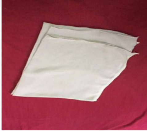
ภาพที่ ๔ ผ้าสไบ