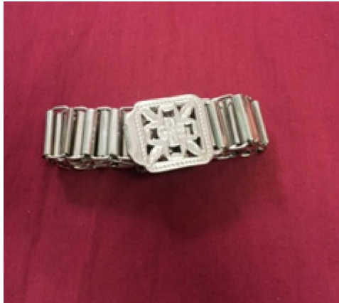
ภาพที่ ๕ เข็มขัด