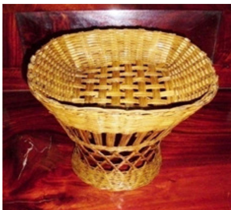
ภาพที่ ๙ กระจย่องใส่บายศรี

กระจย่องสานโดยการใช้ไม้ไผ่ และเคลือบเงาด้วยแลกเกอร์ มีไว้สำหรับใส่บายศรี